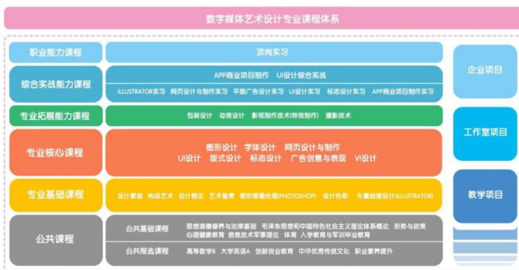
数字媒体艺术设计专业课程体系图

数字媒体艺术设计专业课程体系分为公共基础课、专业基础课程、专业核心课程、专业拓展能力课程、综合实践能力课程、创新创业能力培养课程、职业能力培养课程等。